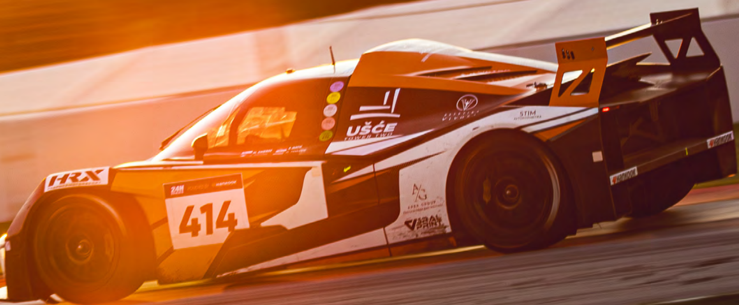
24 ur morajo zdržati vsi štirje dirkači, ki se sicer menjavajo, in seveda tehnika. Mali avstrijski dirkalnik je prišel v cilj.