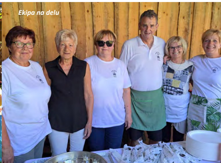
Ekipa na delu