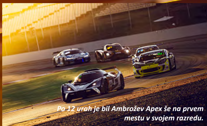
Po 12 urah je bil Ambrožev Apex še na prvem mestu v svojem razredu.