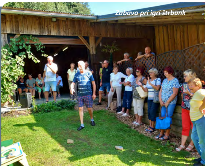
Zabava pri igri štrbunk