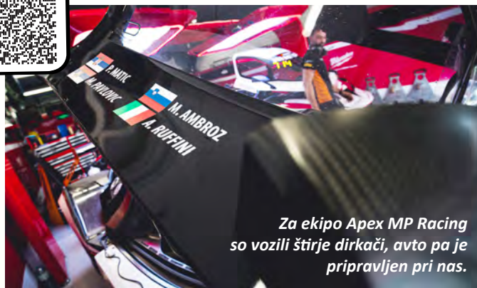
Za ekipo Apex MP Racing so vozili štirje dirkači, avto pa je pripravljen pri nas.