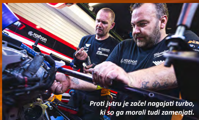
Proti jutru je začel nagajati turbo, ki so ga morali tudi zamenjati.