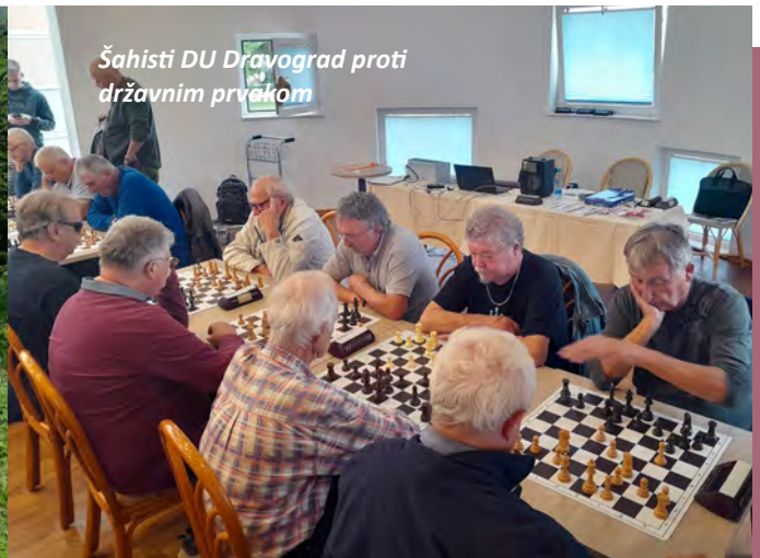
Šahisti DU Dravograd proti državnim prvakom