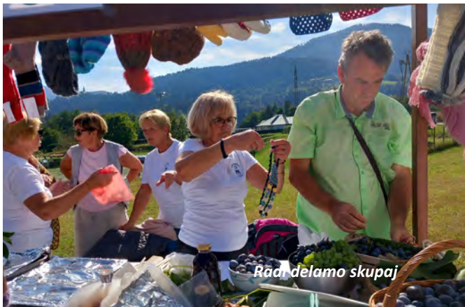
Radi delamo skupaj