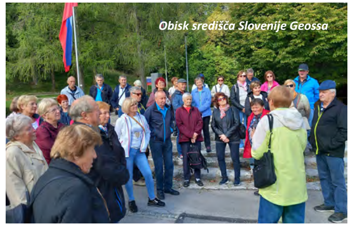
Obisk središča Slovenije Geossa