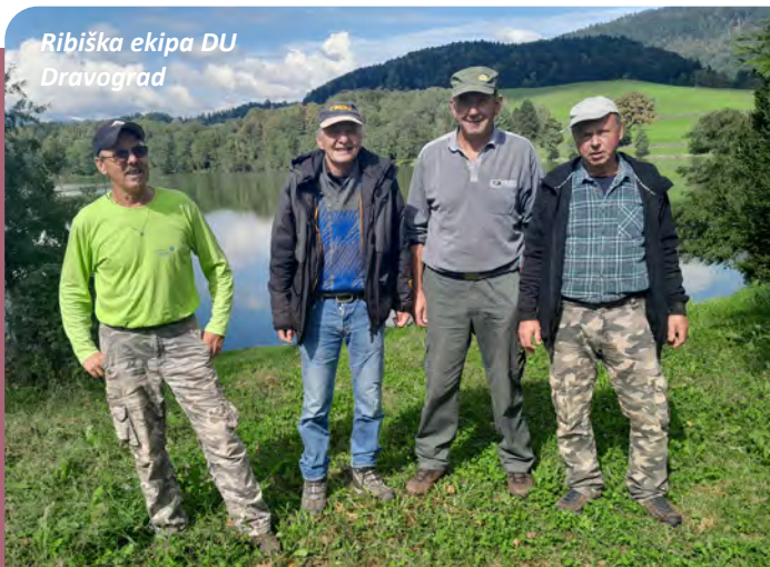
Ribiška ekipa DU Dravograd