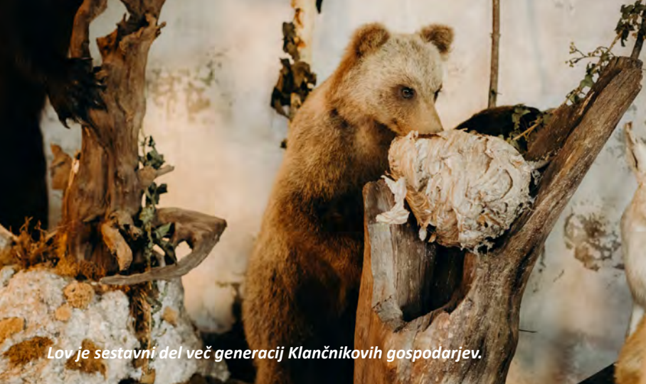
Lov je sestavni del več generacij Klančnikovih gospodarjev.