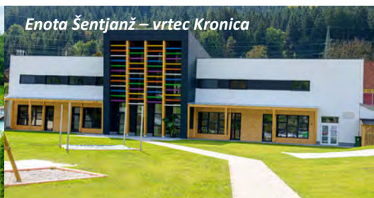
Enota Šentjanž – vrtec Kronica