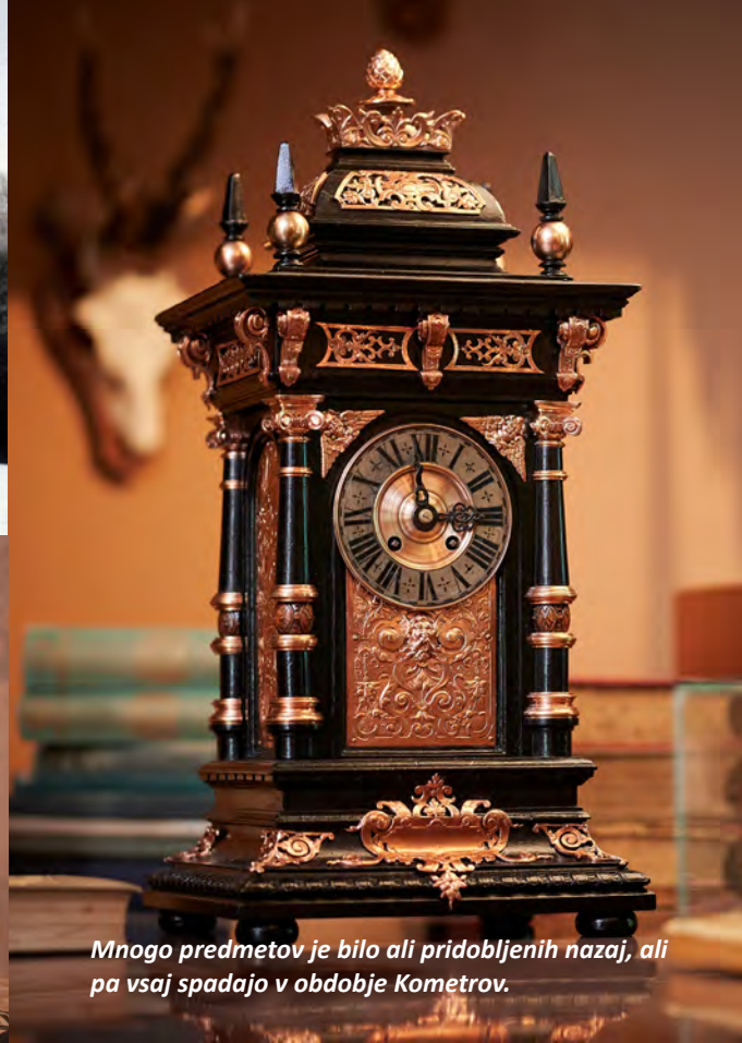
Mnogo predmetov je bilo ali pridobljenih nazaj, ali pa vsaj spadajo v obdobje Kometrov.

tenheim, posest ob Vrbskem jezeru. Leta 1844 jo je dokončno odkupil in se odločil za obsežno obnovo.